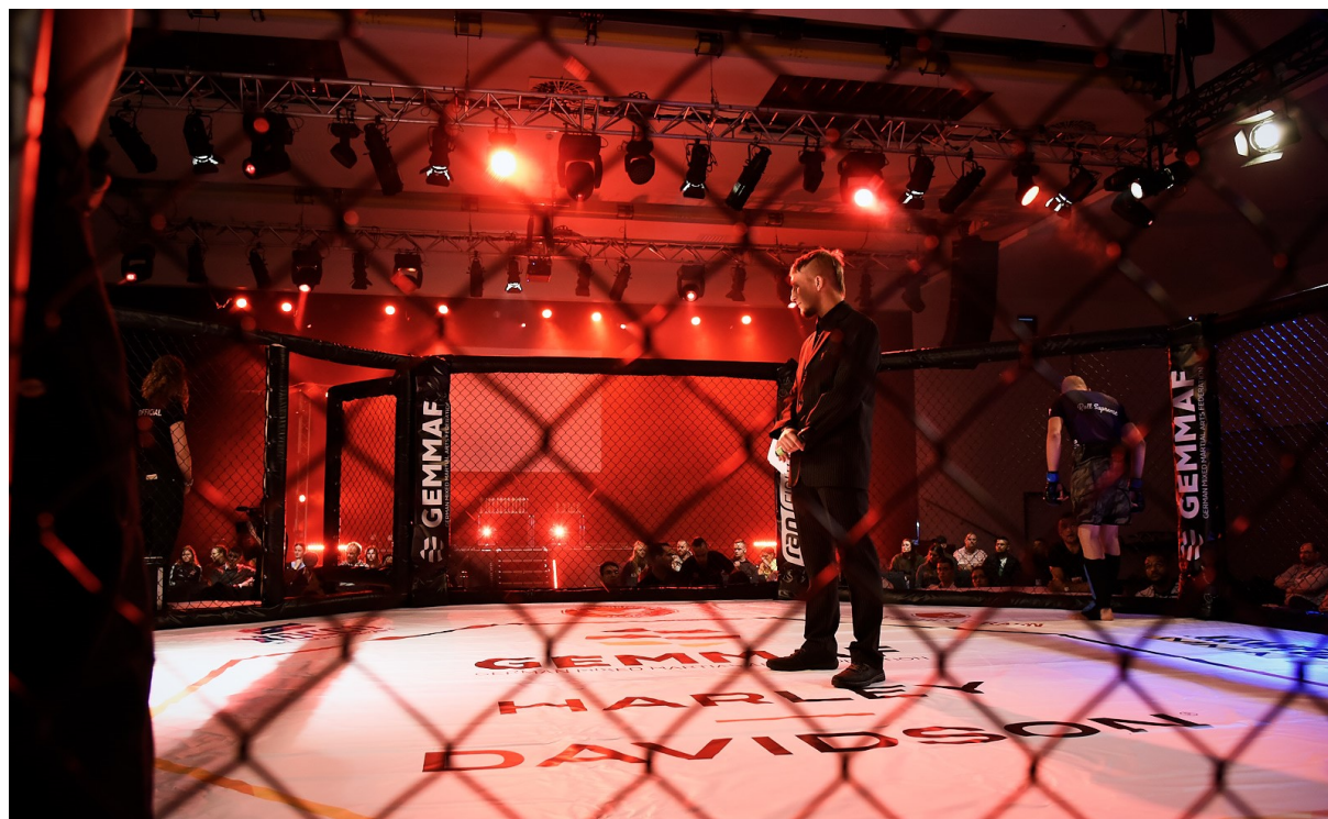
Abbildung 1: GEMMAF Deutsche Meisterschaften 2019

Alle regionalen Meister qualifizieren sich für die deutschen Meisterschaften der GEMMAF im Amateur-MMA am 19. September 2020 in Falkensee bei Berlin. Dort werden in 4-Mann Turnieren die deutschen Meister ausgekämpft! Euch erwartet ein spektakulärer Abend!